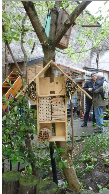
Figure 3 : l'hôtel à insectes : un des dispositifs favorisant la biodiversité les plus répandus (Petits Prés Verts, avril 2011)