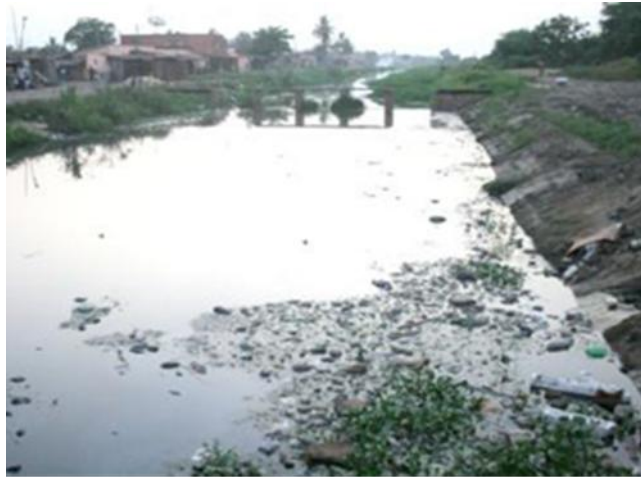
Photo n°1 : Déchets dans le canal d'équilibre dans le quartier de Doulassamé

Avec un effectif peu qualifié qui a diminué en moyenne, de 26 à 70 agents entre 2000 et 2011, Lomé, a du mal à bénéficier pleinement de ses atouts économiques (Port autonome, les marchés dont celui sous régional d'Adawlato, grands commerces, etc.). Avec un budget largement déséquilibré et en faveur du fonctionnement (85 à 97 % des dépenses entre 2006 et 2013), la ville réalise très peu d'investissement en témoigne la dégradation des infrastructures de base (Photo 1).