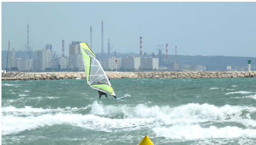
Figure 2 Un territoire industrialo-portuaire aux usages multiples. Sport de mer, quartier urbain et zone industrielle de Lavéra (Martigues).